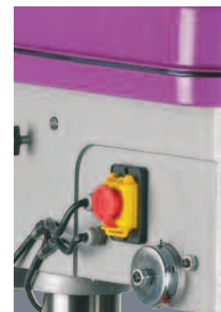
Interrupteur marche/arrêt avec arrêt coup de poing à accrochage