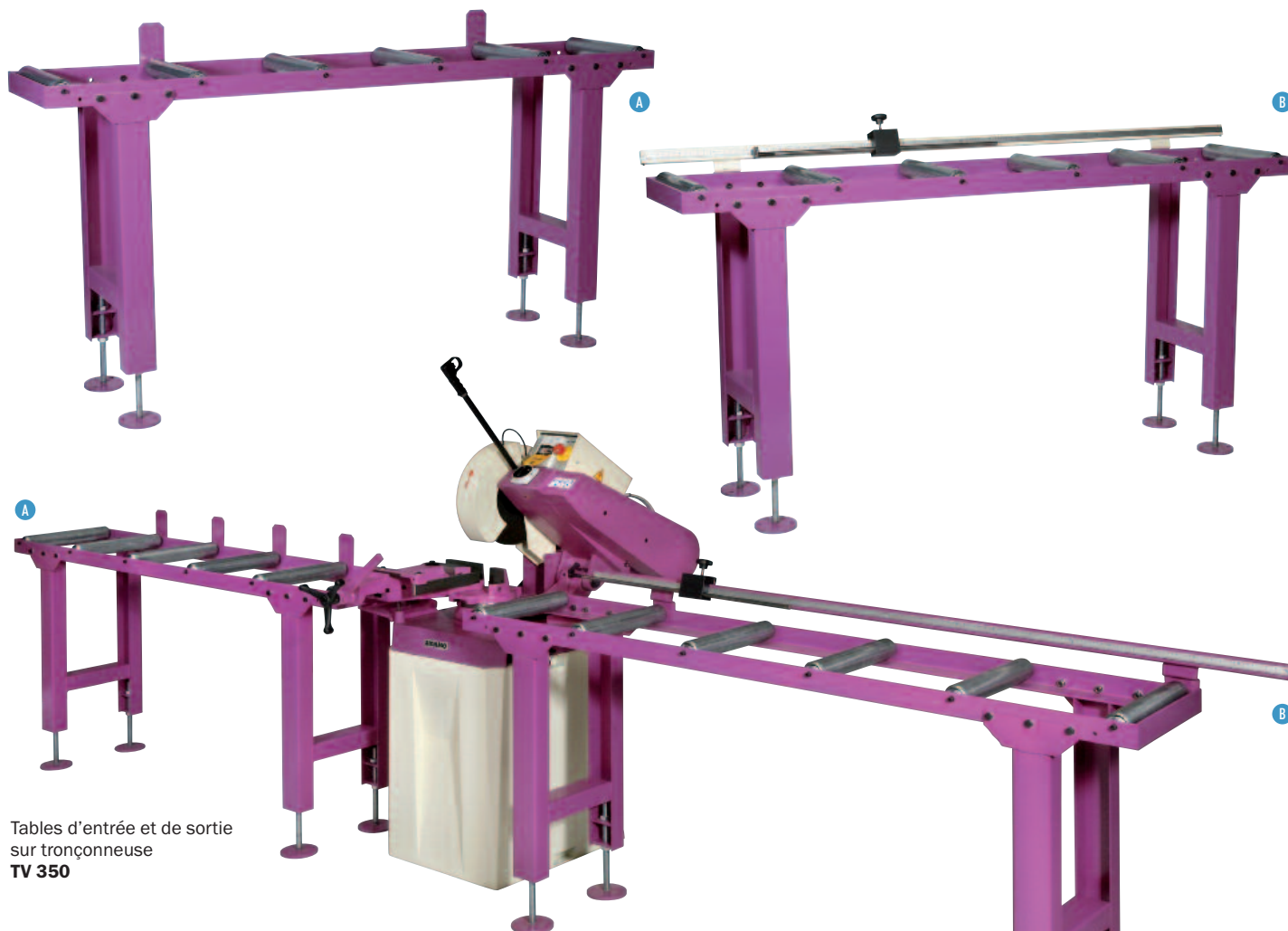
Tables d'entrée et de sortie sur tronçonneuse TV 350