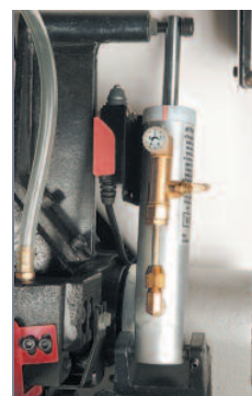
Vérin de descente réglable à double effet

Détendre le ruban en fin de journée. Afin d'obtenir une excellente finition de coupe et une grande longévité du ruban, il est impératif de choisir la denture du ruban, d'adapter la vitesse de descente de l'archet et la vitesse du moteur en fonction du profil de la pièce à couper.