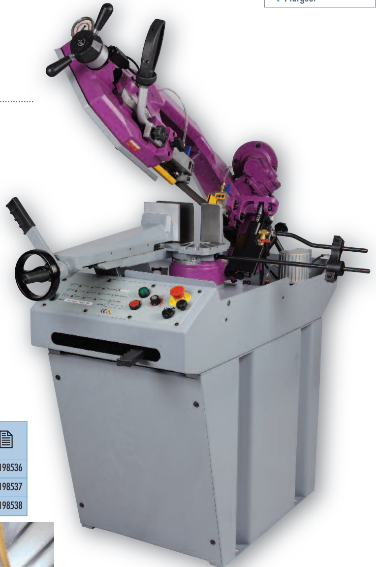
SR 276 DAV.....

Détendre le ruban en fin de journée. Afin d'obtenir une excellente finition de coupe et une grande longévité du ruban, il est impératif de choisir la denture du ruban, d'adapter la vitesse de descente de l'archet et la vitesse du moteur en fonction du profil de la pièce à couper.