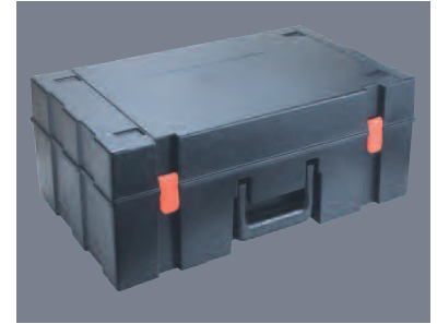
Livrée dans mallette de transport