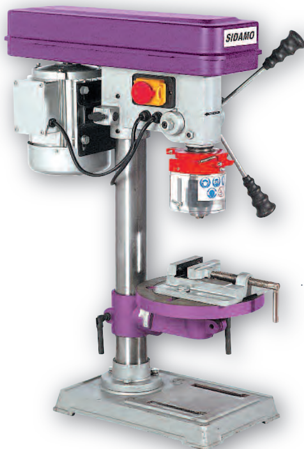
..... 13 A