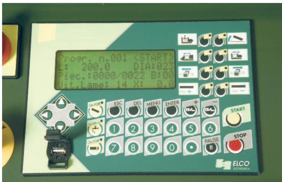
Panneau de commandes CNC