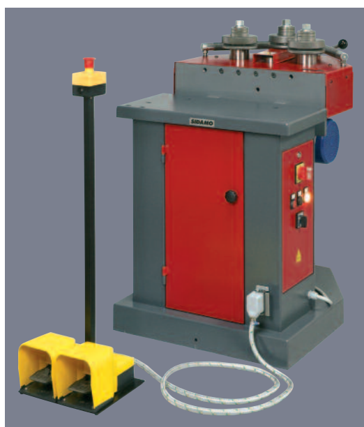
E 60 MV/2 position horizontale